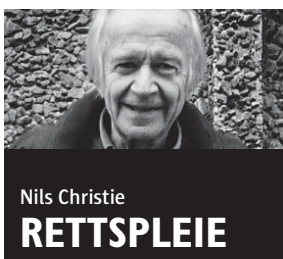
Nils Christie RETTSPLEIE

Vi var i forkant med å etablere konfliktråd her i landet. Allerede i 1991 fikk vi en lov om megling i konfliktråd. «Med dette ble Norge det første landet i verden med en lovfestet, offentlig konfliktrådsordning», sies det på side tolv i forarbeidene til en helt ny lov om konfliktråd som i går ble behandlet i Stortinget.